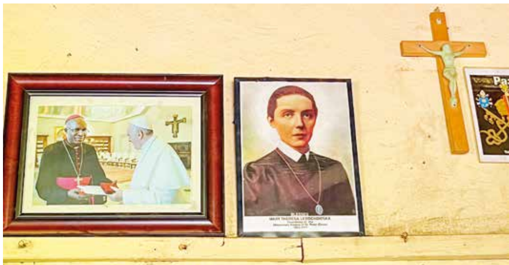
childerijtje van onze Stichteress de zalige Maria Theresia Ledóchowska aan de muur.