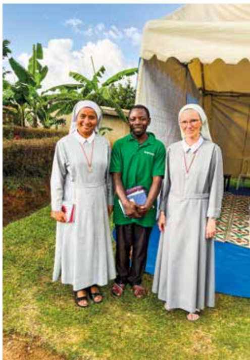
Eén van de vele 'devoti' MTL

De kapel toegewijd aan de Zalige Maria Theresia.