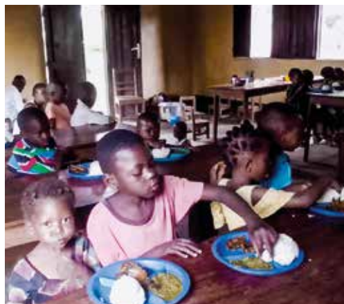
Er zijn hier veel ondervoede kinderen.