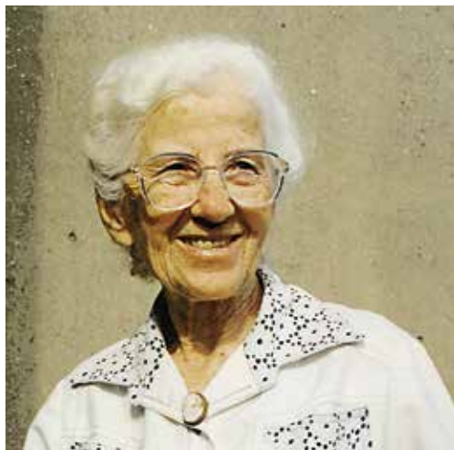
Eén van de vele 'devoti' MTL