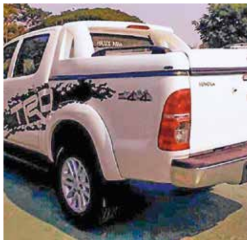
De gedroomde auto.