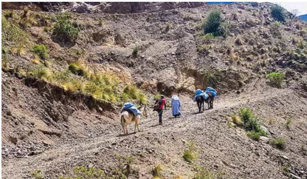
Uren te voet onderweg naar de diverse missieposten in Bolivia.

Onze hartelijke groeten en dank voor uw gift voor ons apostolaat in de parochie van Acchilla. Ik stuur hierbij een foto van onze missie. Zoals u kunt zien, zijn we veel onderweg in onherbergzame gebieden.