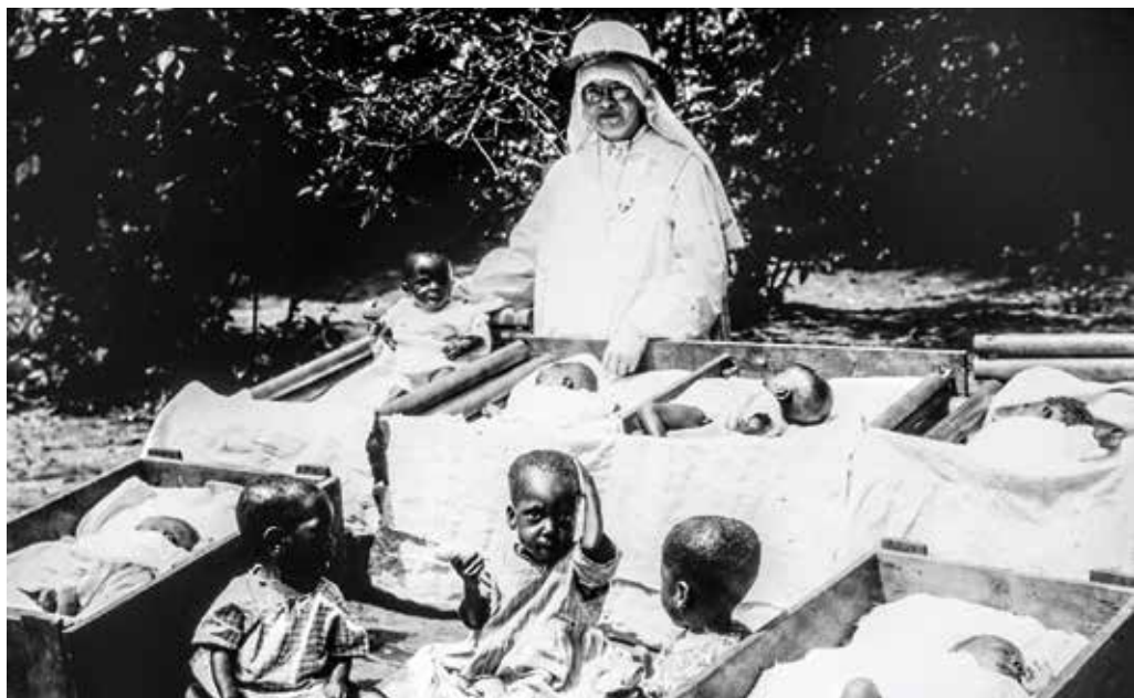
De eerste doopels.

Geboren uit verbazing en geen bekwaamheid van ‘specialisten’.