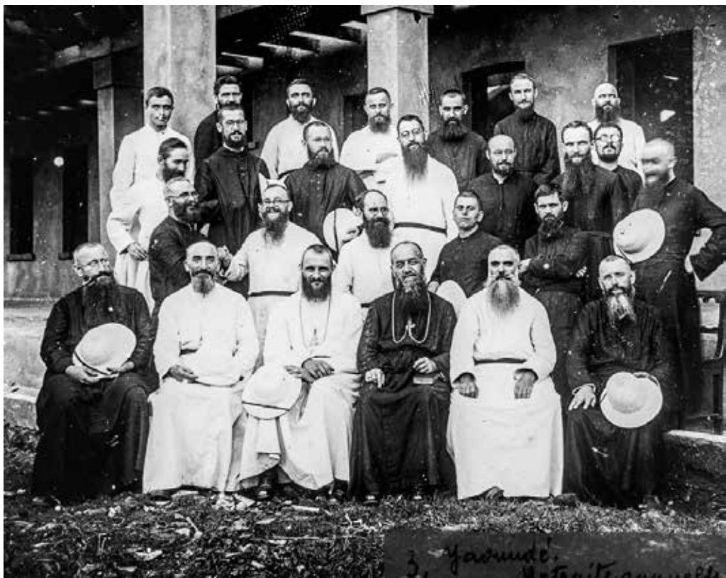
Eerste missie in Afrika.

der zijn 'broer', want er is geen missie zonder overeenstemming. En de boodschap die Christus zelf vraagt naar de vier hoeken van de wereld te brengen is eenvoudig en direct, want het gaat er niet om grondig op de betekenis te studeren, overtuigende toespraken voor te bereiden en duidelijk uit te spreken. In elk huis waar zij binnenkomen hoeven de apostelen, gestuurd door Christus, slechts te zeggen: