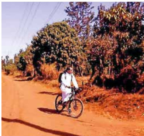
Alles met de fiets