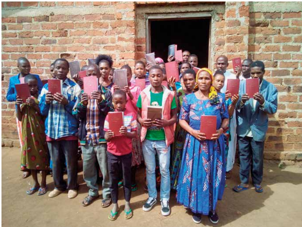
Alle catechisten krijgen een Bijbel.