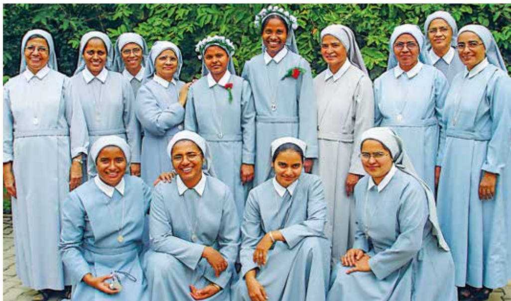
Onze zusters in India met onze huidige Generale Overste links onder.

meenschap van Thanjavur geopend, in de staat Tamil Nadu; twee jaar later in Khammam (Andhra Pradesh), in 2007 in Raisen in het bisdom Sagar, in 2011 in Indore in de staat Madhya Pradesh, en tenslotte in 2013 in Nagpur in de staat Maharashtra, waar nu de zetel van het vormingshuis zich bevindt, terwijl de meerderheid van de kandidaten afkomstig is van het Noorden van India. Momenteel zijn de Indiase zusters ongeveer met negentig, afkomstig van twaalf staten; enkelen werken in Europa, Amerika, Australië en Nieuw-Zeeland, maar de overgrote meerderheid is actief in India. Verspreid over negen gemeenschappen, leiden zij de Pauselijke Missiewerken op diocesaan niveau, animeren zij de Missionaire Jeugd-groepen, evangeliseren de jongeren en houden zich bezig met catechese van de kinderen en de volwas-