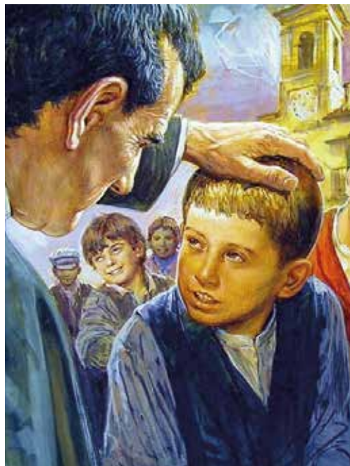
Don Bosco met straatkinderen.

Ten eerste omdat klagen de situatie alleen maar erger maakt, maar ook omdat vertrouwen ons in staat stelt de nodige afstand te nemen om te begrijpen: in dit vertrouwen wordt onderwijs mogelijk.