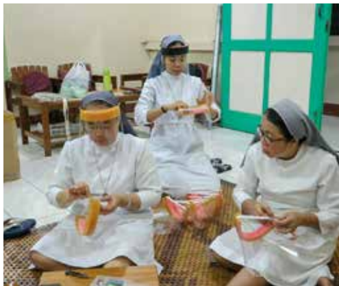
Zusters bereiden zich voor op de verzorging van Covid-patiënten.