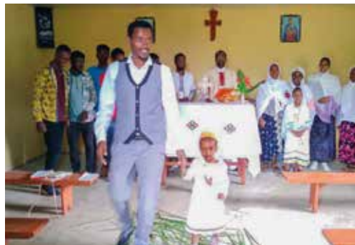
De inzegening van de kerk te Alga