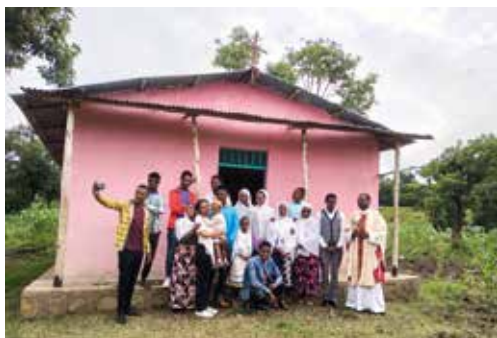
Een kleine nieuwe kerk

Allereerst onze excuses voor de vertraging van ons financieel rapport. Recent zijn er etnische botsingen geweest in Jinka en omgeving. Er vielen hierbij 30 doden. Hierdoor was ook alle