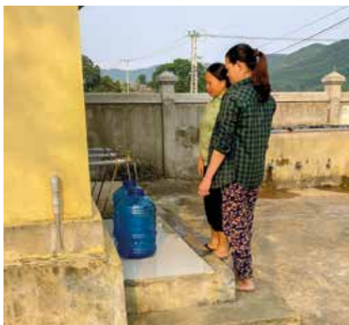
Waterfiltersysteem in Bong Lai.

Uit naam van alle begunstigen van onze parochie Bong Lai, zou ik graag mijn diepste gevoelens van dankbaarheid willen uitspreken voor u die ons geholpen heeft met het bouwen van het waterfilterings-systeem in onze parochie in het Ha Tinh bisdom.