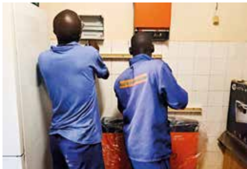
Monteurs zorgen dat alles functioneert.

voedsel. Volgen nog enkele foto's van alles wat we hebben kunnen realiseren dankzij uw steun! Wees verzekerd van ons gebed voor u allen.