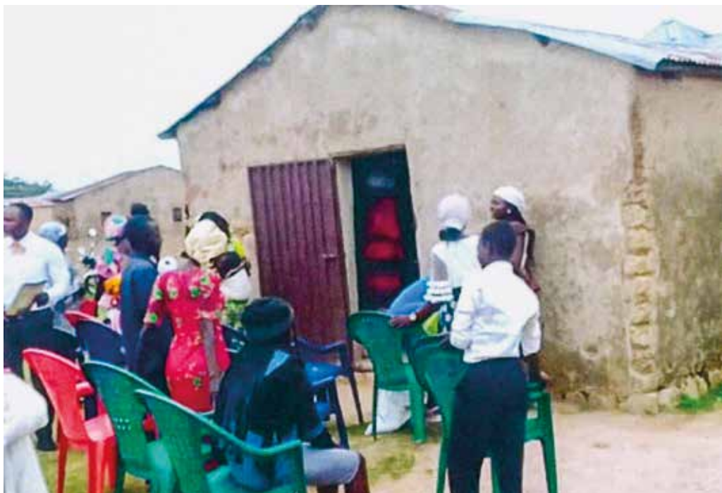
De huidige 'kerk' te Kabwir in Nigeria.