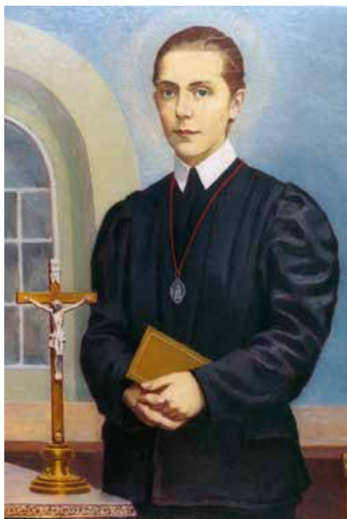
Schilderij Z. Maria Theresia.

Vroeger was Afrika overspoeld door belangenconflicten, uitgebuit en geregeerd door corrupte systemen. Zoals de