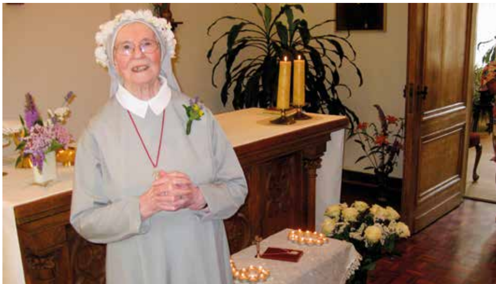
Zomer 2019 60 jarig Jubileumfeest in onze kapel.

krijgen. En dat op loopafstand van ons klooster. In 5 minuten waren we daar. En bij het verzorghuis, de Beyart, welk vroeger van de Broeders van Liefde was geweest, waren vele broeders en zusters en er heerst nog een religieuze sfeer. Haar Spaanse vrolijkheid bleef; zodra ze muziek hoorde, begon ze te dansen! Toen kwam de corona als een venijnige onverwachte klap. We waren blij dat we allemaal tweemaal gevaccineerd waren en waanden ons veilig.