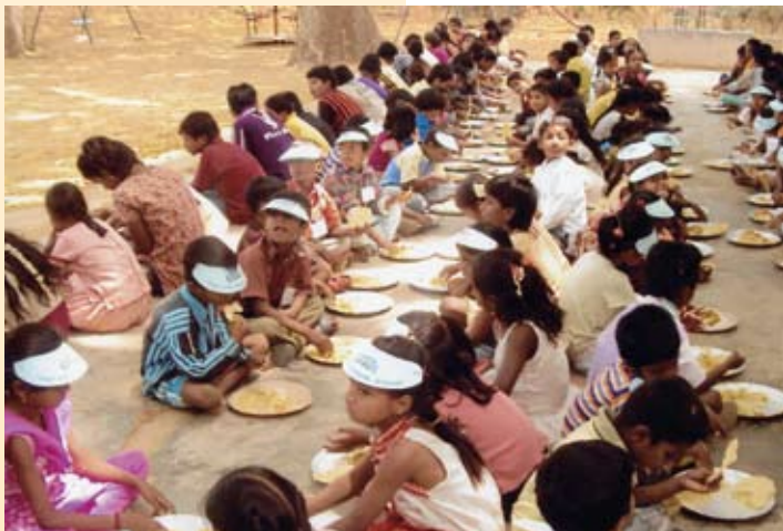
De kinderen ontvangen bij ons ook ontbijt en middagen

te bevrijden van de eeuwenoude mythes die hen tot slavinnen maken in een door mannen gedomineerde samenleving. Voor de economische emancipatie zijn systemen voor microkredieten en microfinanciering geïntroduceerd waarvan vrouwen profiteren om een beter inkomen te verwerven door kleine bedrijven op te richten. Ons uiteindelijke doel is voor en met de bewoners van de slums een vrouw- en kindvriendelijke maatschappij