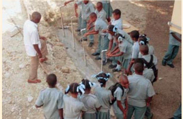
Nieuw aangelegde waterleiding op de binnenplaats van de school