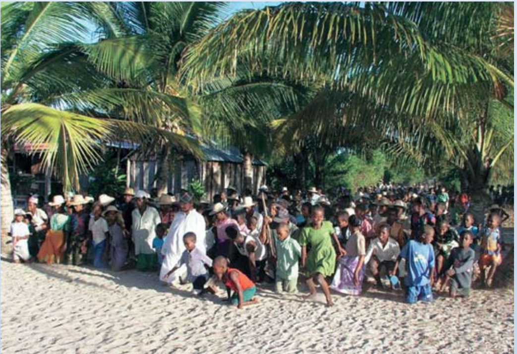
We deden de het laatste deel van de kruisweg op onze knieën

Er hebben altijd verhalen over geestesver-