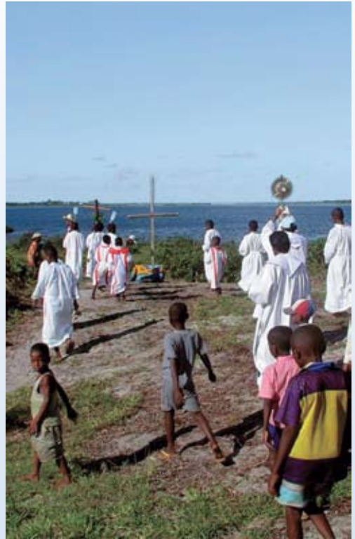
Op weg naar de wijding van het nieuwe kruis bij het Rangazawaka meer

De laatste 180 meter vanaf de laatste kruiswegstatie tot aan het kruis deden we op onze knieën. Het was bijna 12 uur 's middags en hoewel het maar 20 graden was, was het zand brandend heet. Door mijn persoonlijk voorbeeld hoopte ik duidelijk te maken dat het kruis niet slechts boetedoening en opoffering symboliseert, maar uiteindelijk ook een zegeteken is. Deze dag is me levendig bijgebleven. Terwijl ik op mijn knieën kroop, bemerkte ik een vrouw naast me. Ze keek me wantrouwend aan. Maar later op de avond