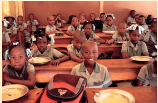
Onderwijs wordt in tenten gegeven