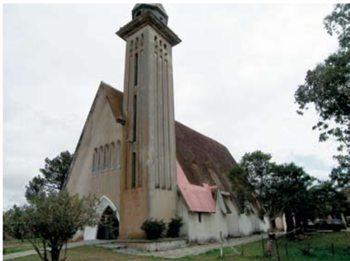
De parochiekerk die dringend opgeknapt moet worden

De parochie van de Heilige Isabella van Hongarije bevindt zich in de stad Salinas in Uruguay. Ze bestaat uit zeven pastorale centra voor de 35.000 inwoners. De parochie verzorgt de catechese voor kinderen, jongeren en volwassenen, sacramentele voorbereiding, sociale activiteiten ter bevorderen van de gehele mens, en andere diensten in overleg met andere