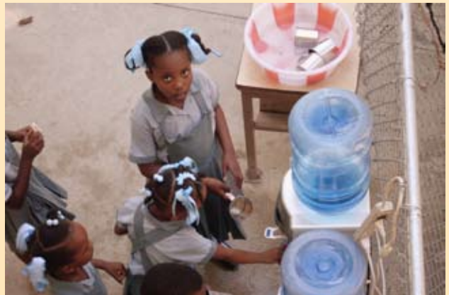
Nieuw sanitair en schoon drinkwater