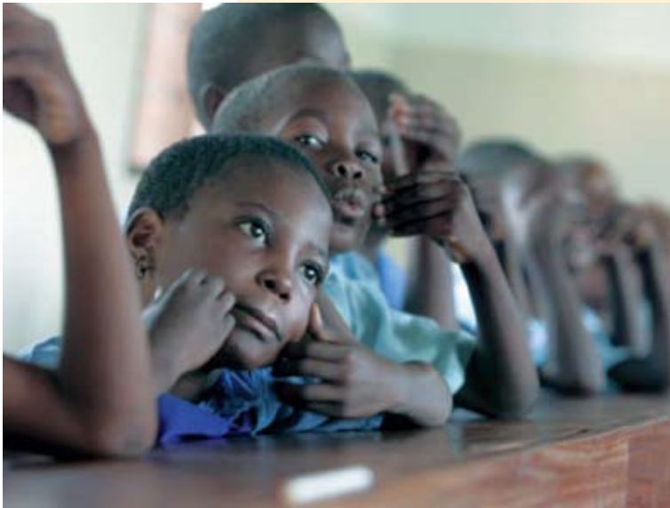
Kinderen uit Tanzania

Hoewel een simpel verhaaltje, blijft het voor mij steeds betekenisvol en leerzaam. Ik hecht er nog altijd aan het te vertellen omdat het zo onwaarschijnlijk lijkt. Maar het is daarentegen waar gebeurd. Een ver-