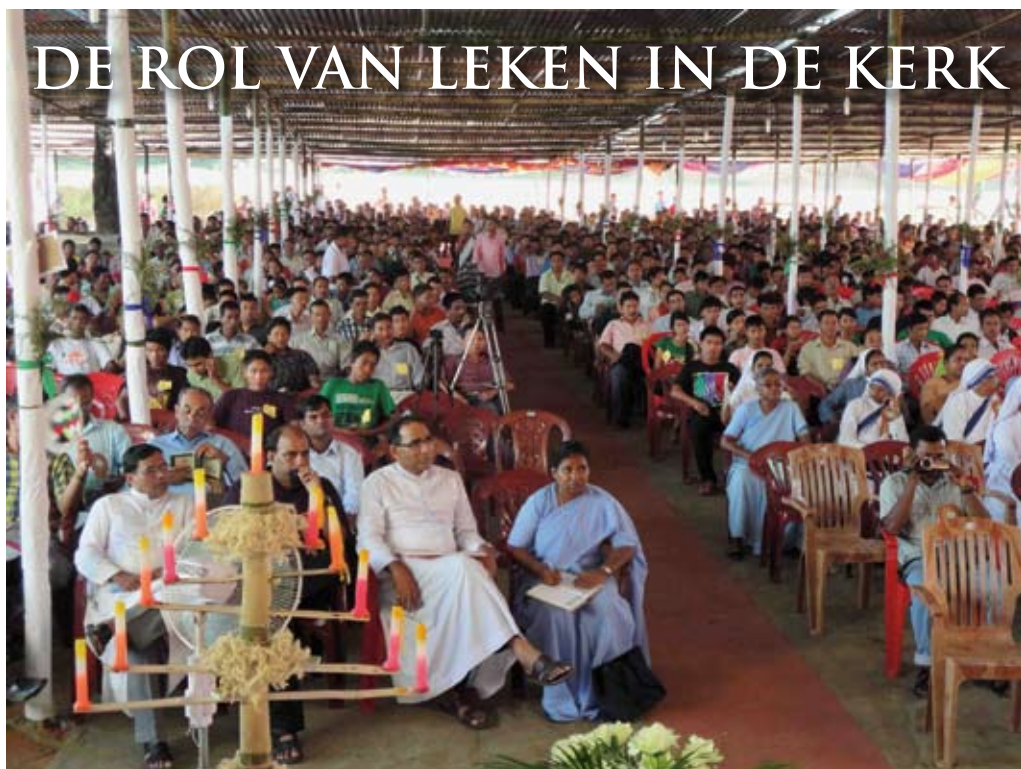
Deelnemers aan het congres over de rol van de leken in de evangelisatie

De Katholieke Kerk in Tripura (India) is helemaal klaar voor een grotere betrokkenheid van leken bij de missie van de Kerk. Van 6 tot 9 oktober 2011 vond in St. Arnold's Ambassa in het district Dhalai een congres plaats over de rol van leken in de evangelisatie.