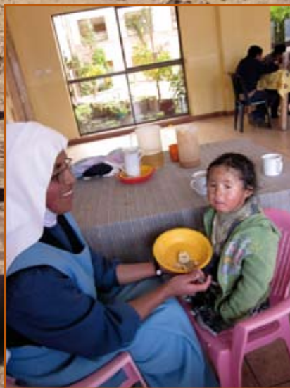
Aandacht, voedsel en medische zorg voor kinderen.