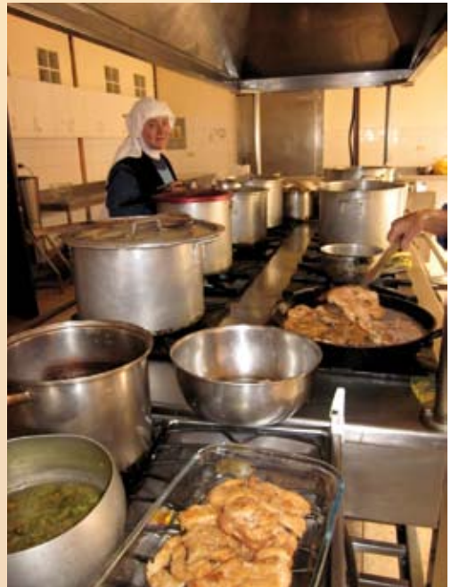
Kijkje in de keuken waar de zusters de maaltijden voor de kinderen bereiden

"De Heer schenkt ons meer als wij weggeven uit liefde voor Hem. Als wij aan de armen geven, dan geven wij aan Jezus zelf. Het is beter arm te zijn dan rijk, want niet de rijken zijn gelukkig, maar zij die de wil van God doen".