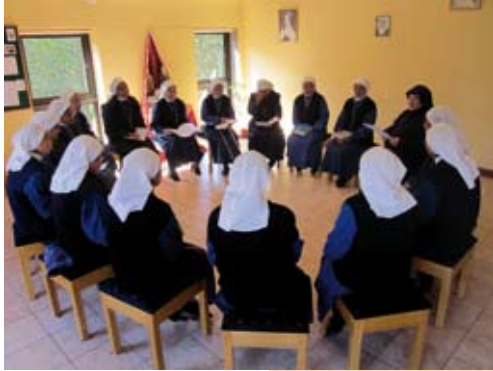
De gemeenschap van de "Dienaresen der Armen"