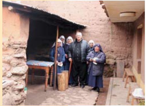
Onze gemeenschap is in het hele dal waartoe dit dorp behoort, de enige katholieke groepering

Het aantal kinderen neemt steeds toe. De zieke kinderen die wij opnemen in onze huizen zijn verlaten kinderen of kinderen voor wie de familie te arm is om voor te zorgen